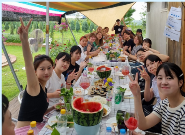
韩国传统游戏体验